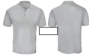
Técnicos en Servicios Gastronómicos