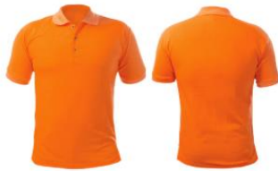
Técnicos en Gestión Tributaria