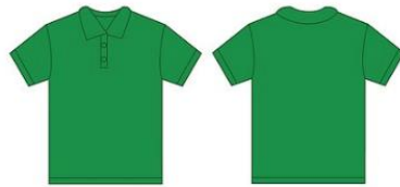
Técnicos en Equipos Electrónicos