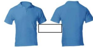
Técnicos en Artes